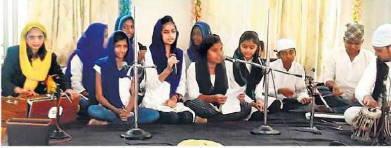
गुरुपूरब सोहळ्यात भजन म्हणताना विद्यार्थिनी, दुसऱ्या छायाचित्रात संस्थेतील गुरुद्वारासमोर काढण्यात आलेली रंगबेरंगी फुलांपासूनची भव्य रांगोळी